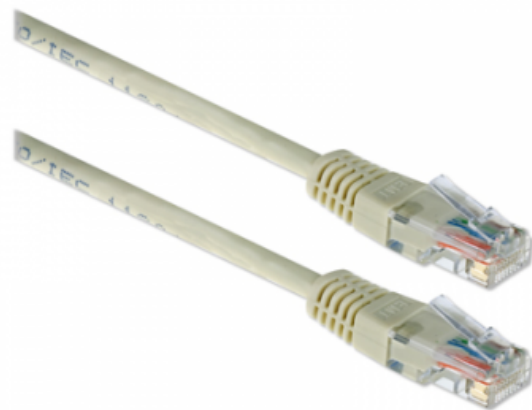
UTP kabel cat 6

Een UTP kabel is een (internet) netwerkkabel waarmee de computer bekabeld wordt aangesloten op de Fritz!Box 5490 (zie de afbeelding van de Fritz!Box hierboven). Een bekabelde aansluiting van de computer garandeert het behoud van de snelheid zoals deze door uw provider wordt aangeboden. Ervaring leert dat het gebruik van WIFI voor internet heel goed kan, maar nooit de maximale snelheid kan opleveren. Muren en de afstand tot de WIFI router (de Fritz!Box) bepalen de maximaal haalbare snelheid. Bij een aangeboden snelheid van 100 mb wordt bij kwalitatief goede kabels ook 100 mb op uw computer gehaald. Oudere computers zijn veelal nog niet voorbereid op hogere internetsnelheden. Bijvoorbeeld: bij een abonnement van 500 mb of meer haalt de computer bekabeld aangesloten (met UTP kabel) maximaal 100mb. Op dat moment is het zeer waarschijnlijk dat uw UTP aansluiting in de computer aanpassing nodig heeft. De computer speciaalzaak heeft hier vaak goede oplossingen voor.